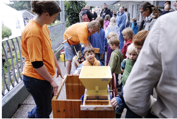
Apfelsaft pressen und ganz frisch genießen...

pflanzen und Kräuter vor. Und wer noch frisches Biogemüse oder Ziegenkäse einkaufen wollte, der wurde im Zelt der „Kleinen Gemüse­gärtnerei Mohrkirch“ bzw. dem Wagen von „Jahnkes Ziegen­käse“ fündig.