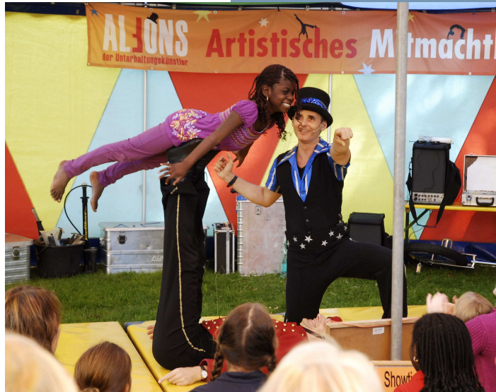
Veritas als Artistin

Mit der großen Abschlussvorstellung der kleinen mitKids Artisten endete ein wunderbares Sommerfest 2011.