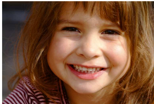
Wir sagen Danke für Ihre Spende!

Mit Ihrer finanziellen Unterstützung geben Sie rund 3.600 Kindern jedes Jahr die Chance auf eine glückliche und selbstbestimmte Zukunft. Herzlichen Dank!