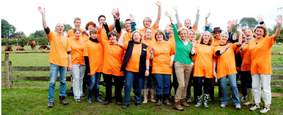
Das ganze Team und viele HelferInnen freuten sich über die 400 Gäste

Beim Tag der offenen Tür gab es viel zu entdecken