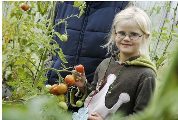
„Ach so wachsen die Tomaten!“

Der Förderkreis der Ehlerding Stiftung versammelte sich zwischen­durch zu seiner Jahreshauptversammlung, bei der unter anderem die Anschaffung von neuen Spielgeräten für Hof Norderlück auf der Agenda stand.