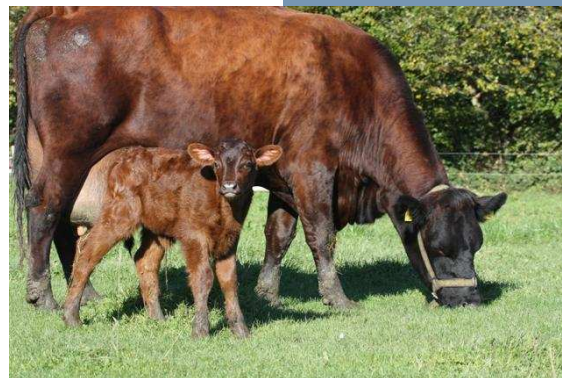
Frida und Peggy

Wir bedanken uns bei unseren Gästen, Freunden und Förderern für das uns entgegengebrachte Vertrauen, die vielen positiven und konstruktiven Rückmeldungen und die finanziellen Unterstützungen. Ihnen und Euch allen wünschen wir eine schöne Adventszeit und einen guten Start ins Jahr 2011.