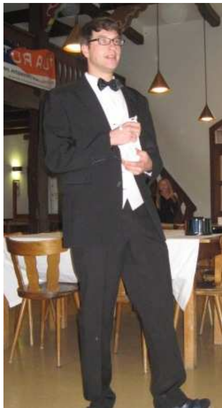
Croupier und Moderator