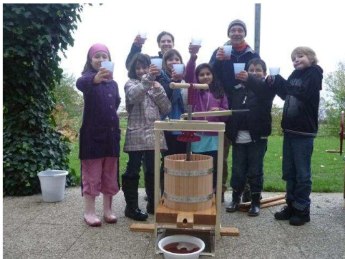
„Vielen Dank für die Apfelpresse. Prost!“

Herzliche Grüße von der Ostsee das Team von Hof Norderlück