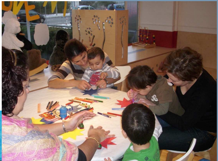
Mütter und Kinder beim Basteln