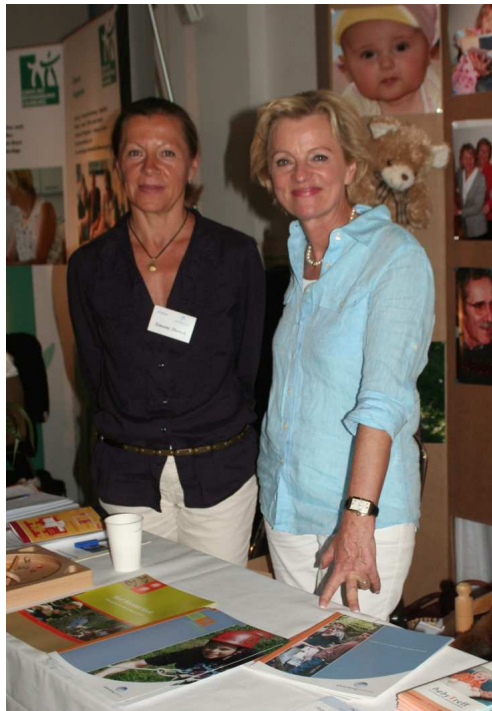
Hamburger Familientag 2009